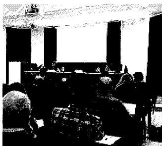
In via Lippi. L'incontro sulle politiche commerciali aziendali