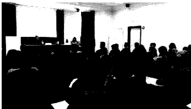
Una fase del seminario organizzato nella sede di Apindustria

Apindustria Brescia rinnova lo sforzo a supporto dell'internazionalizzazione delle imprese. Un impegno concretizzato con il seminario sulle «politiche commerciali e organizzazione delle reti di vendita», organizzato nella sede dell'organizzazione di via Lippi alla presenza di oltre sessanta rappresentanti di aziende del territorio.