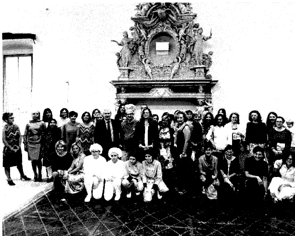
Squadra vincente. Ecco le donne che hanno concluso il percorso «Tornare al lavoro! Non è mai troppo tardi»

benessere, informatica, orticoltura e floricoltura, autoimprenditorialità: sono 78 le donne, sulle 137, che hanno concluso il percorso. La Provincia ha stanziato 30mila euro di incentivi economici per le aziende per l'inserimento lavorativo: fino ad ora sono arrivate sette assunzioni a tempo determinato, due tirocini lavorativi di un anno, nell'ambito dell'iniziativa regionale «Dote comune», altri sette in aziende private più altri in corso di definizione.