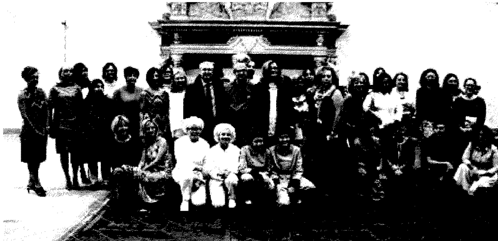
Il gruppo di donne che hanno partecipato al progetto di formazione per il reinserimento lavorativo

euro per aiutare donne over 40 inoccupate o disoccupate a rendersi autonome», ha sostenuto Morelli. Le donne che avevano aderito al progetto, inizialmente, erano 137: dopo i primi step, alcune hanno abbandonato e alla fine sono rimaste in 78. Grazie ai partner del progetto (Camera di commercio, Aib, Casa delle donne, Apindustria, Scuola bottega artigiani di San Polo, Associazione formazione Giovanni Piamarta e Okschool academy), le donne hanno partecipato a corsi di formazione per cura persona, floricoltura, panificazione e pasticceria e sartoria. «Ogni 100 donne nel entrano nel mondo del lavoro, si creano 15 posti di lavoro nei servizi, le famiglie hanno un doppio reddito, più benessere, si crea un aumento del Pil - ha spiegato Silvana Gallizoli, sociologa esperta di orientamento e bilancio delle competenze -. Le quarantenni sono una risorsa preziosa, nel corso della formazione c'è stato un aumento della consapevolezza delle proprie capacità e l'individuazione di nuove aree di interesse».