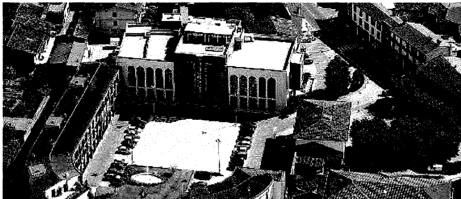
Il quartier generale a Pompiano. La sede della Bcc Pompiano Franciacorta

Ai soci della Bcc di Bedizzole andrà una azione della nuova banca del valore nominale di 51,64 euro ogni due azioni del valore nominale di 30 euro (ai soci verranno poi attribuite per i resti azioni della nuova banca). Ai soci della Pompiano per ogni azione del valore nominale di 51,64 euro verrà conferita una azione di analogo valore.