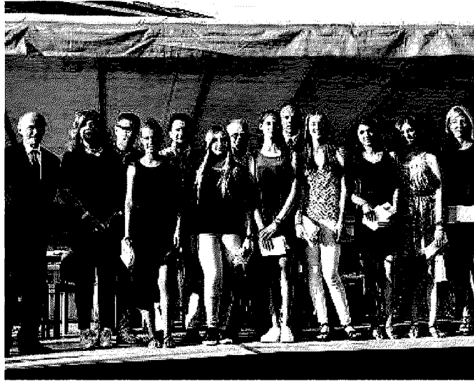
La cerimonia. Un gruppo di diplomati del Lunardi // FOTO NEG