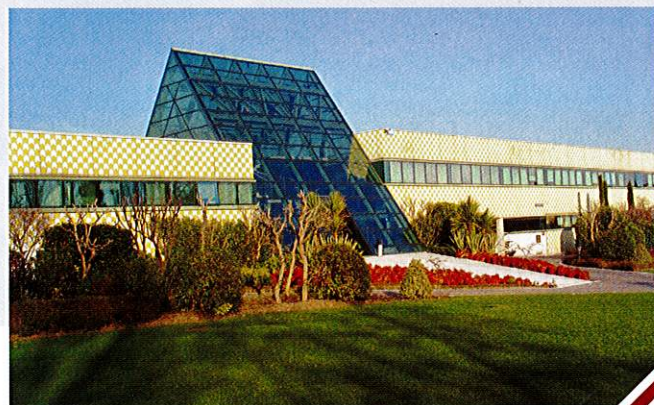
LO STABILIMENTO DI POLPENAZZE, SEDE DEL CENTRO PROGETTAZIONE E SVILUPPO CAMOZZI

del mercato interno. Un trend di crescita costante, peraltro, che si era interrotto solo nel 2009, e che oggi costituisce un segnale particolarmente incoraggiante per l'economia e la crescita del nostro Paese.