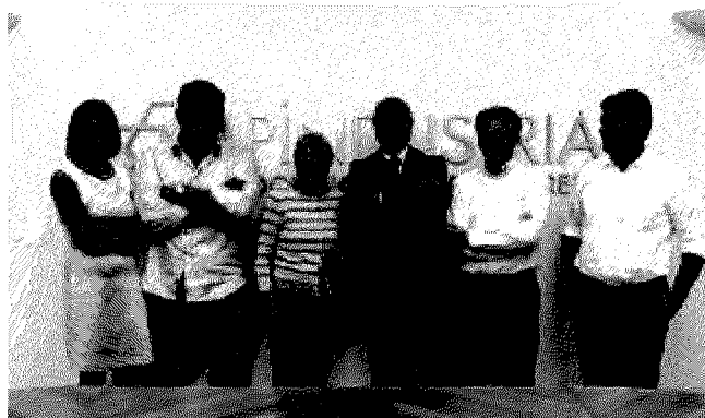
La nuova Giunta di Apindustria

«Eredito una realtà solida grazie all'azione della precedente Presidenza, Giunta e del Direttivo, che è riuscita a riportare il bilancio in utile negli ultimi tre anni e che ha operato in modo costruttivo in un momento evidentemente complicato. Ora Apindustria deve prendere il posto che le spetta nel panorama economico provinciale».