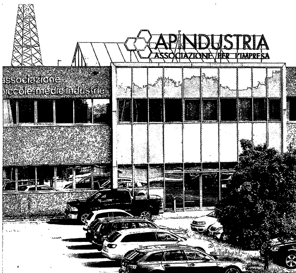
La sede. Apindustria rappresenta le piccole e medie imprese bresciane

Nel frattempo si aiutano anche le imprese associate a crescere e a internazionalizzarsi.