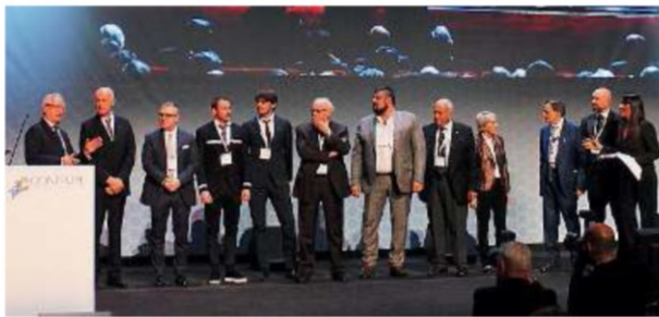
Sul palco. I nove imprenditori bresciani premiati a Roma