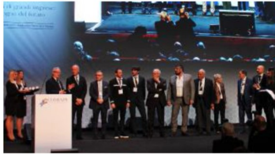
I bresciani protagonisti nell'ambito della festa dei 70 anni di Confapi

Un riconoscimento alle imprese della provincia dalla Confederazione presieduta da Casasco