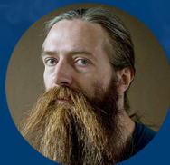
Aubrey De Grey Adsense University Google

Il parterre di relatori sarà di primissimo livello e vedrà la partecipazione di figure internazionali di grandissimo prestigio tra cui :