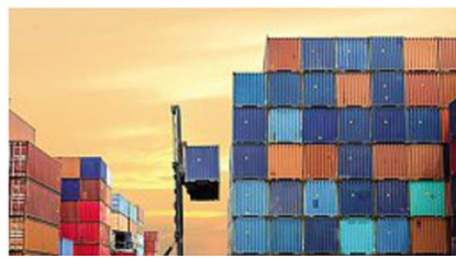
Export Crollo verso estremo Oriente e verso l'India

Sostanzialmente stabile invece la Francia, secondo mercato di riferimento, con 552,6 milioni. Fuori dall'Europa il